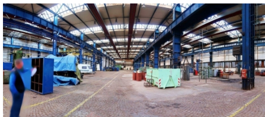
2.900 m2, nájem 60,-Kč/m2/měsíc Praha 4