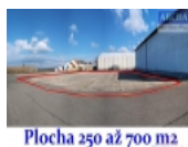
Plocha 250 až 700 m2