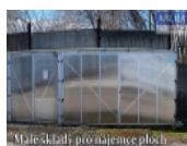
Mateřskými pronájemce plochy