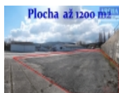
Plocha až 1200 m2