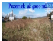
Pozemek až 4000 m2