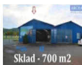
Sklad - 700 m2