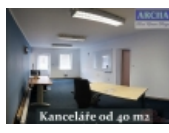
Kanceláře od 40 m2