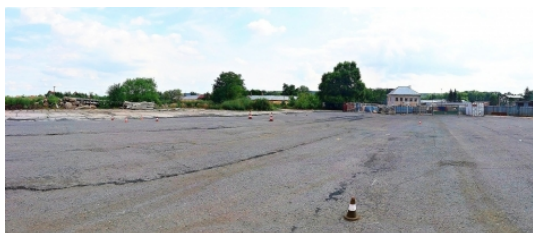
Průmyslový pozemek - až 20 000 m 2 Libochovice

Prodej pozemku 10 000 m 2 , určený pro komerční výstavbu, Libochovice (okres Litoměřice)