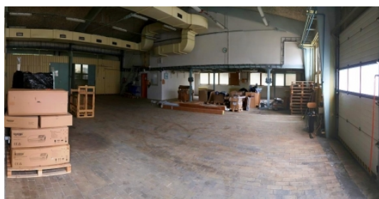
Sklady 290 až 900 m2, Hořovice