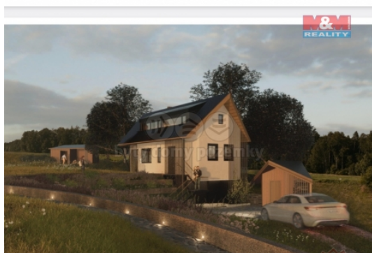
FFJ REALITY VIZUALIZACE Z JIHOVÝCHODNÍ STRANY